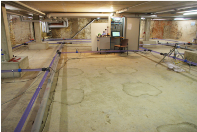
Fig. 3. Le réseau pilote dans les locaux de TZW à Dresde.